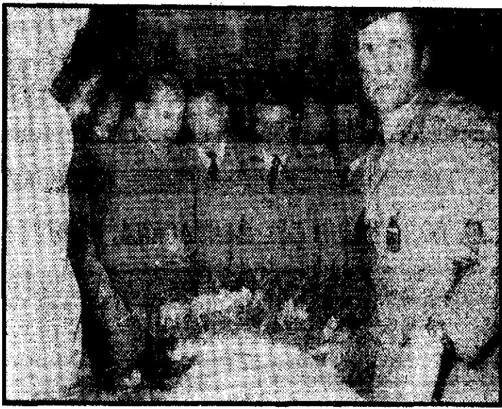
Jefes y compañeros del cabo de la Policía Armada, muerto durante el acto terrorista perpetrado en Barcelona, velaron durante toda la noche el féretro.

Muerto en Barcelona, como consecuencia de un atentado terrorista, el miércoles